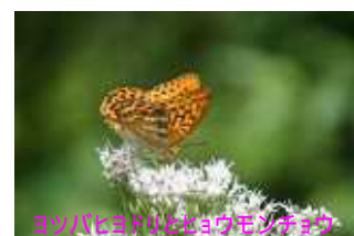
ヨツバヒコドリ(ユウモロコキ)

15,000円(実費として保険料1,500円と交通費・宿泊費約42,000～60,000円が必要になります)